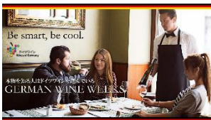
ランチョンマット (Luncheon mat)