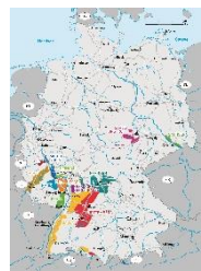
地図ポスター (Map poster)