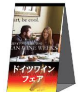
テーブルテントPOP (Table tent POP)