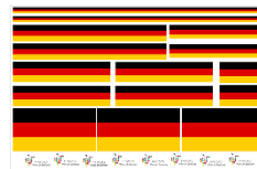
ドイツ国旗ステッカーシール (Sticker Seal German)